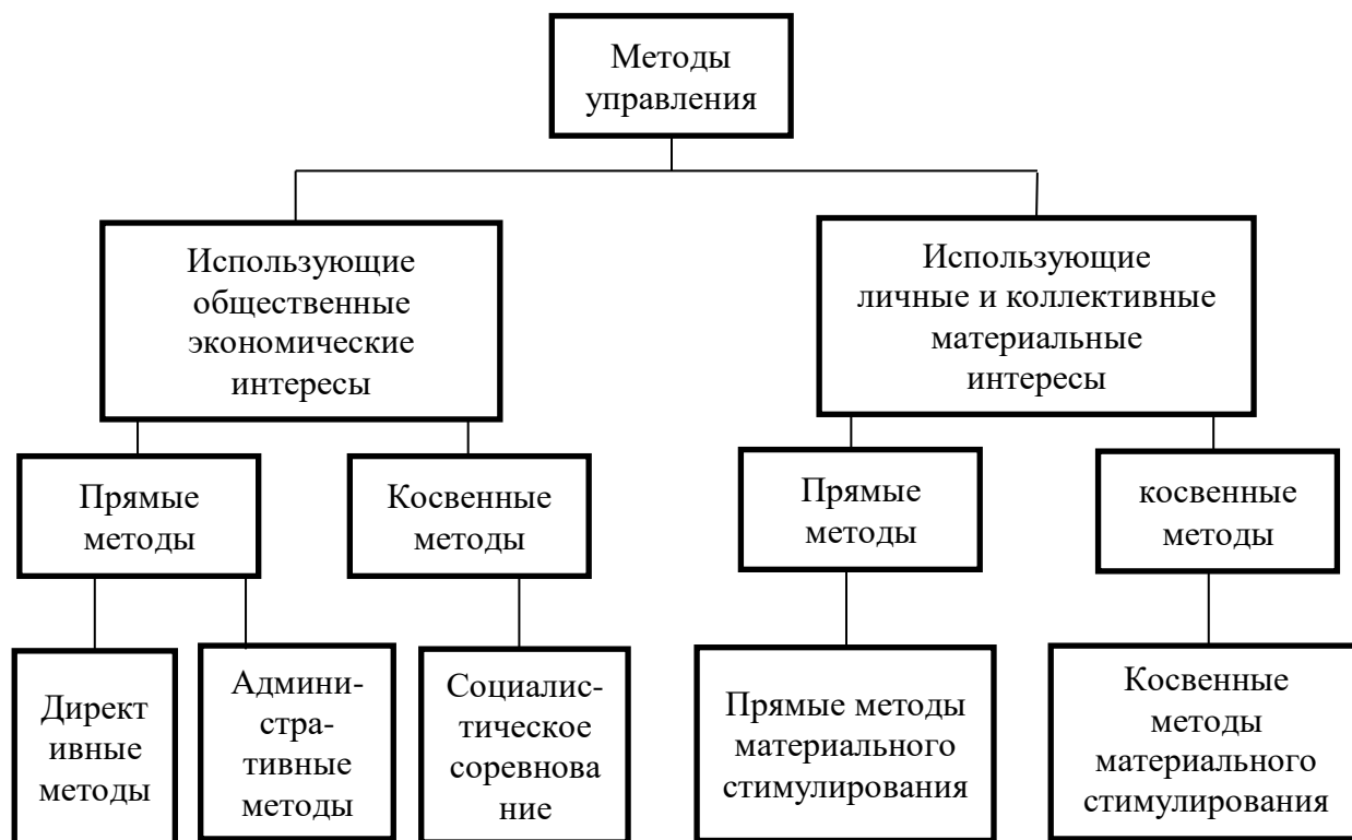
Рисунок 1 Система экономических методов управления при социализме

Директивные и административные методы состоят в том, чтобы на