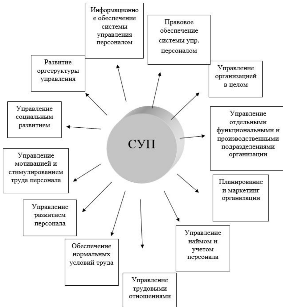
Рисунок.1 - Состав подсистем системы управления персоналом организации

Анализ системы управления человеческими ресурсами и диагностика персонала включает в себя (рисунок 1):